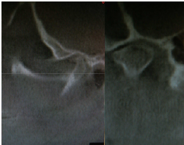
Kiefergelenk zur 3-D Diagnostik, in Verbindung mit Kieferrelationsbestimmung

Die Diagnostik umfasst die klinische Untersuchung, eine Kieferrelationsbestimmung, manchmal auch eine 3-D-Diagnostik, Abformung, Modellerstellung mit Artikulator, bis hin zur individuellen Schienenerstellung.