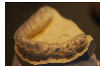
Schiene im Unterkiefer